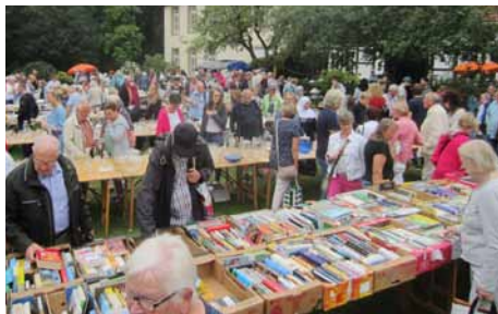
Riesenandrang bei der Hofauktion 2019

Die Attraktivität und der Erlös steigerten sich von Jahr zu Jahr. War der Überschuss