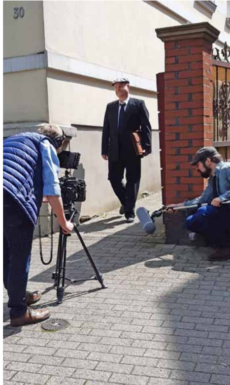
Dreharbeiten zum Video am Haus Süntelstraße 30 in Osnabrück