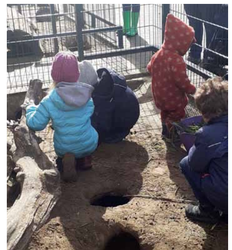
Fütterung der „Raubtiere“