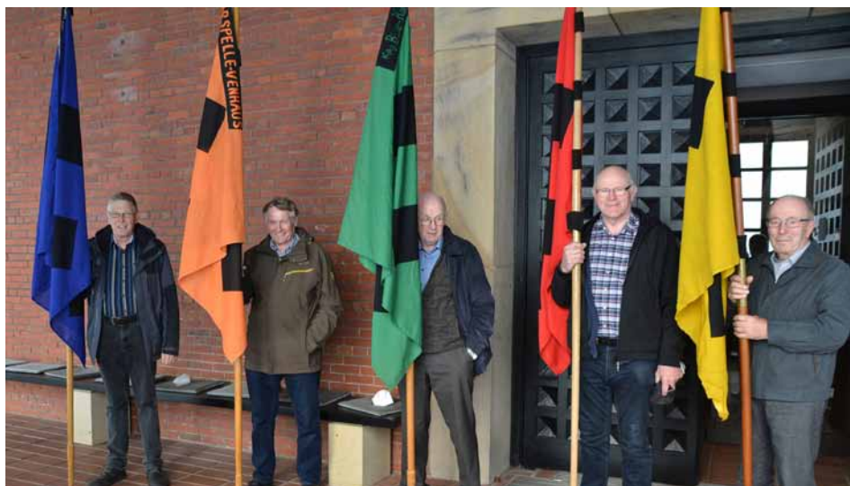
Fahnenträger in der St.-Josef-Kirche