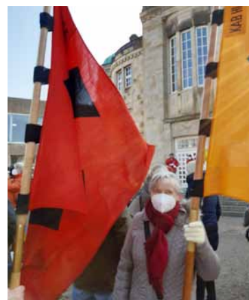
KAB-Flaggen bei der Friedensdemonstration in Osnabrück