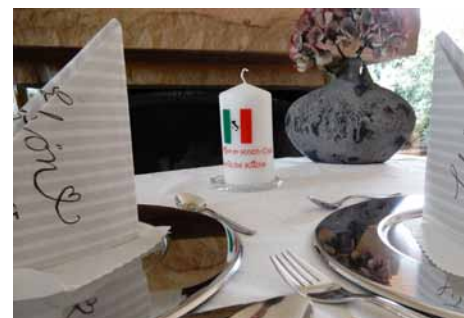
Festlich gedeckter Tisch

mer das „Festmenü“ gekocht und dann im Anschluss mit den jeweiligen Partnern verspeist werden. Getrennt und doch gemeinsam. Auf dem Laufenden blieb man innerhalb der Gruppe bei Rezeptauswahl und Zubereitung des Menüs sowie dem individuellen Anrichten der Speisen und beim Abendessen durch einen sehr intensiven Fotoaustausch per WhatsApp.