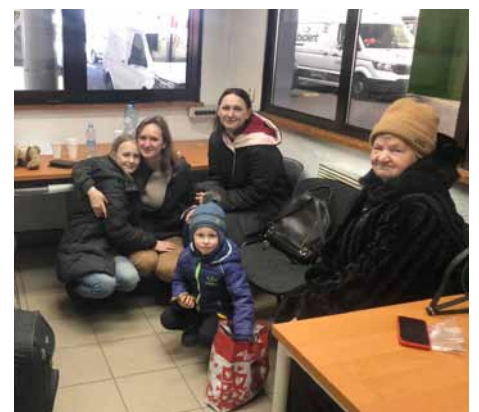
Endlich in Sicherheit!

Widerstand gegen russische Soldaten. Im Wechsel kommen in diesem urbanen Krieg auch Zivilisten zwischen die Fronten. Noch immer soll es über 100000 Menschen in der Stadt geben. Der Bedingungen lassen sich kaum in Worte fassen. Die Stadt muss als zerstört betrachtet werden. Ein Wiederaufbau wird Jahrzehnte in Anspruch nehmen. Wir selbst (also die Familie meiner Frau) haben Menschen in dieser Stadt bei den Bombardierungen verloren. Gleichzeitig konnte sich aber auch meine Schwägerin mit Kindern und einer Großmutter aus der Stadt retten. Wir konnten sie an der polnisch-ukrainischen Grenze in Empfang nehmen und sie leben jetzt in der Gemeinde Bissendorf. Meine Nichte wird sogar ab dem 20. April die Schule besuchen. Für alle gilt aber, dass sie sehr traumatisiert sind. Zu den Schwiegereltern und anderen Bekannten gibt es noch immer keinen Kontakt. Wir können insofern nur beten. Die Flucht meiner Schwägerin mit Kindern